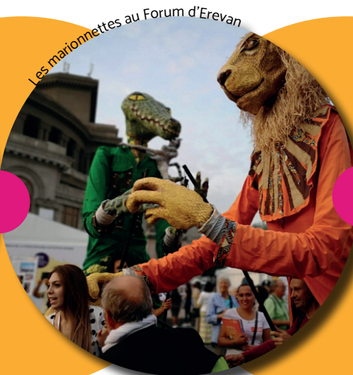
Les marionnettes au Forum d'Erevan